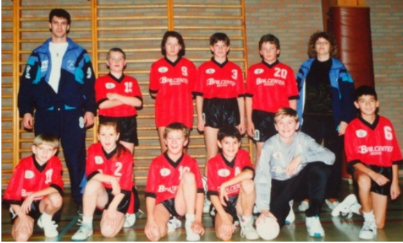
De eerste jeugdploeg van Handbal Achilles Bocholt

Een jaar later, september 1991, werd een deel van deze groep te oud voor de Pupillen, maar gelukkig waren er genoeg andere spelers gevonden om samen met hen een tweede jeugdploeg in competitie te brengen, de iets oudere Miniemen. Geen vrees voor de Pupillen, want ook zij konden blijven bestaan. Bocholt speelde dus al met 3 ploegen in competitie.