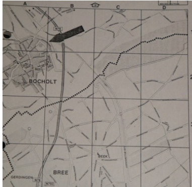
De locatie van Sporthal Bocholt in het officiële VHV-boekje

Internet ook een vaardigheid was die men onder de knie moest hebben – niet altijd van de eerste keer succesvol.